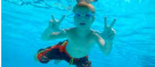
Subsidies voor zwembad Molenheide p.2