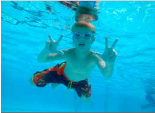
▲ Vlaanderen maakt 425 000 vrij voor de renovatie van het zwembad.

Het dossier dat de gemeenten Peer en Houthalen-Helchteren indienden voor de renovatie van het zwembad Molenheide, is gekeurd. Vlaams minister van Sport Philippe Muyters trekt hier 425 000 euro voor uit. Molenheide zelf voorziet een totale investering van tussen de 1,25 en 1,5 miljoen euro.