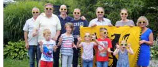
N-VA Peer: altijd bij je in de buurt p.3