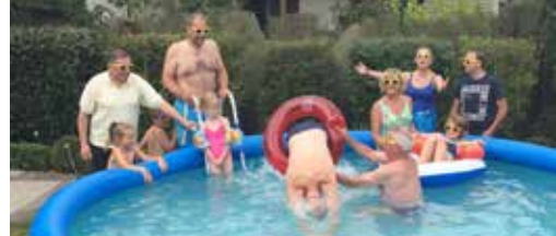
Tweede kans voor nieuw zwembad p.3