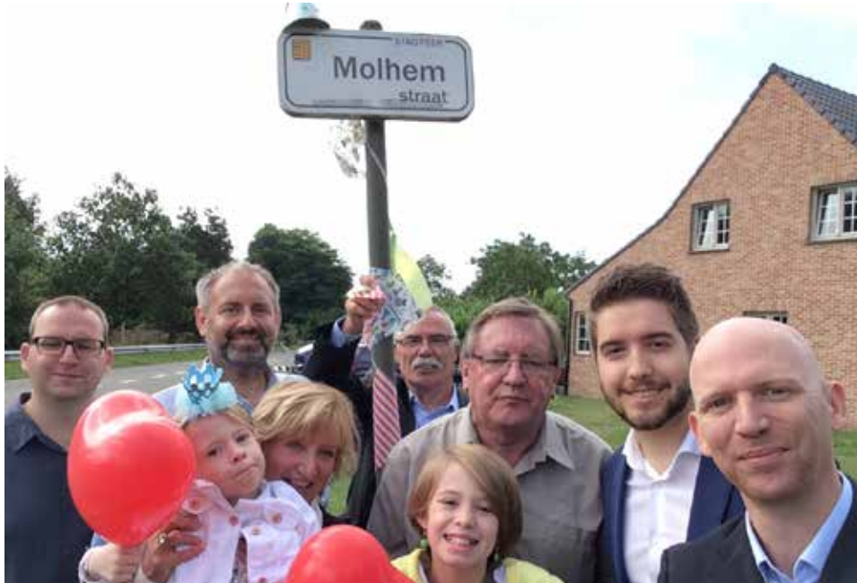
▲ De Molhemstraat was de honderdste straat in Peer die N-VA Peer op bezoek kreeg.

Als drie jaar lang peilt N-VA Peer naar het klimaat in [uw straat]. Inmiddels bezochten we al 100 straten in onze stad. Dat leverde naast de leuke babbels ook uitstekende suggesties en bemerkingen van de Perenaars op.