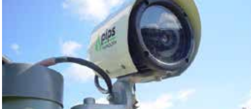
Trajectcamera's schieten met kanon op mug p.2